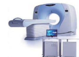
高速マルチヘリカルCT