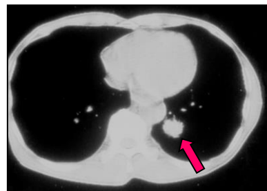
写真2 CT画像（心臓の影に隠れた肺がん）