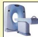
高速マルチヘリカルCT