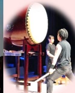
職員有志による 和太鼓演奏