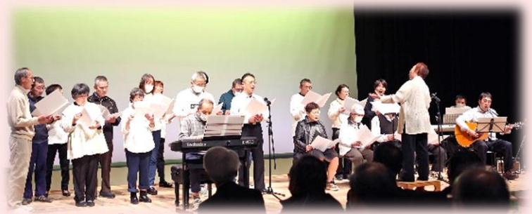
コミュニティハウスはしま・ふれあい工房ふれんど音楽クラブ