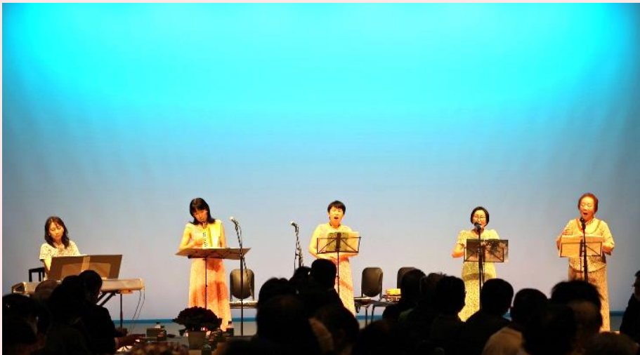
エリザベトフレンズ松江の皆様

また、職員有志による和太鼓演奏、利用者様の合唱発表等も行い、日頃の練習の成果を披露されました。楽しい時間を過ごし、地域の皆様と親睦を深める良い機会となりました。