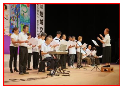
障がい福祉サービス事業所の皆様