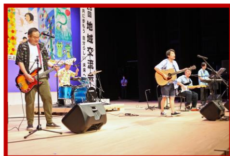
アロハワエ〜ズの皆様

7月13日に開催しました地域交流会は、お陰様で650名を超える方々にご来場いただきました。オープニングでは、社会医療法人昌林会職員有志による和太鼓が披露されました。ふれあい発表会では、せんだん会梨の木園様、昌林会障がい福祉サービス事業所の利用者様による心に響く歌や演奏が披露され素晴らしい発表会になりました。