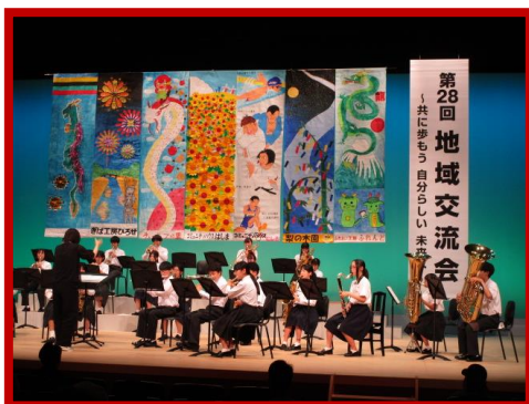
安来一中吹奏楽部の皆様