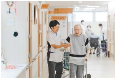
病棟内リハビリの様子