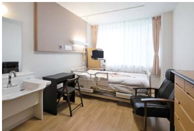
回復期リハ病棟は50床のうち42床が個室(洗面台、トイレ、チェスト付)