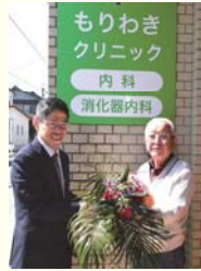
昌林会が引き継ぎました