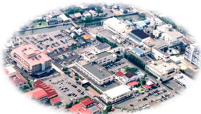
昌林会施設の全景