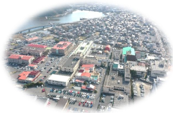
昌林会施設の全景