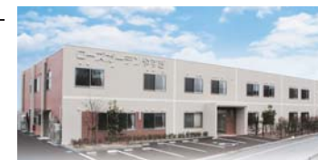
ローズガーデンやすぎ