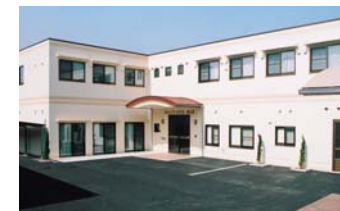
コミュニティハウス はしま