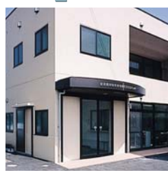
安来地域活動支援センター ステップ