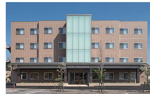
介護老人保健施設 昌寿苑 介護医療院 昌寿苑