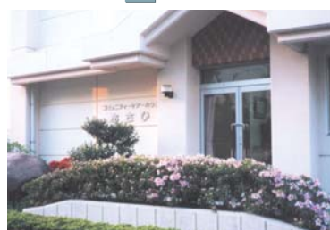
コミュニティハウス あさひ