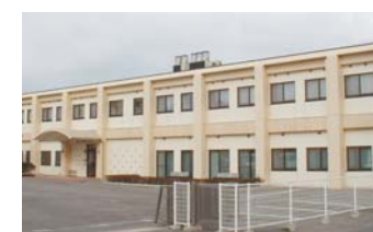
コミュニティハウスにしき