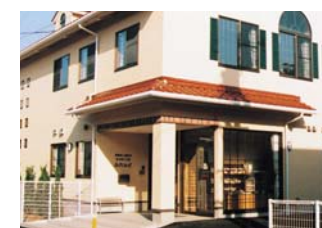
ふれあい工房ふれんど