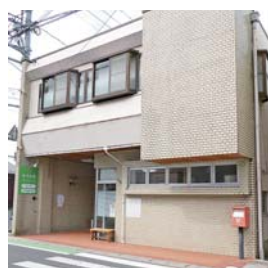
もりわきクリニック

共同生活援助事業所(グループホーム) 共同生活介護事業所(ケアホーム) あおぞら