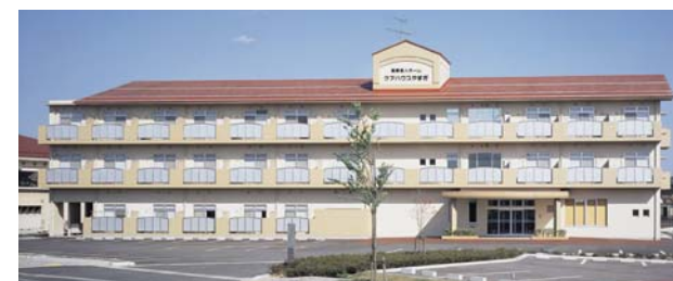
ケアハウスやすぎ