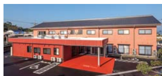
ローズガーデン荒島

荒島ふれあいの郷 認知症高齢者グループホーム パルツガーデン 小規模多機能型居宅介護事業所 エスポワール