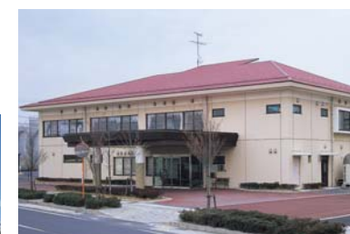
ケアポートやすぎ