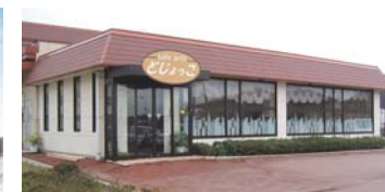
ワークセンターやすぎ