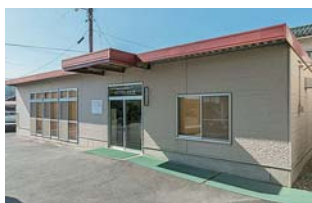
ケアプランやすぎ