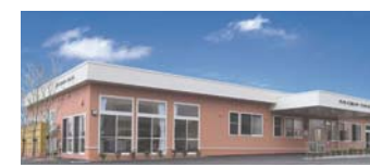
デイサービスセンター フィットネス