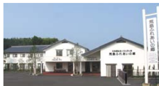
荒島ふれあいの郷